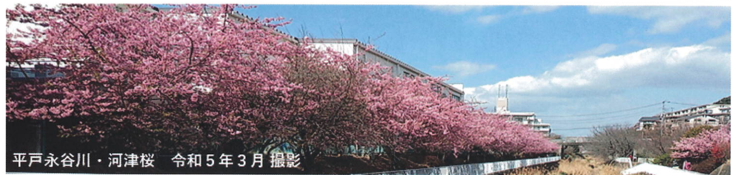
平戸永谷川・河津桜 令和5年3月 撮影