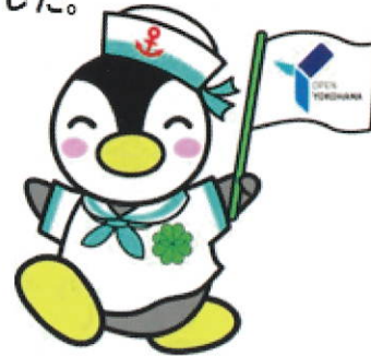
横浜市版民生委員・児童委員キャラクター 「よこはまミンジー」